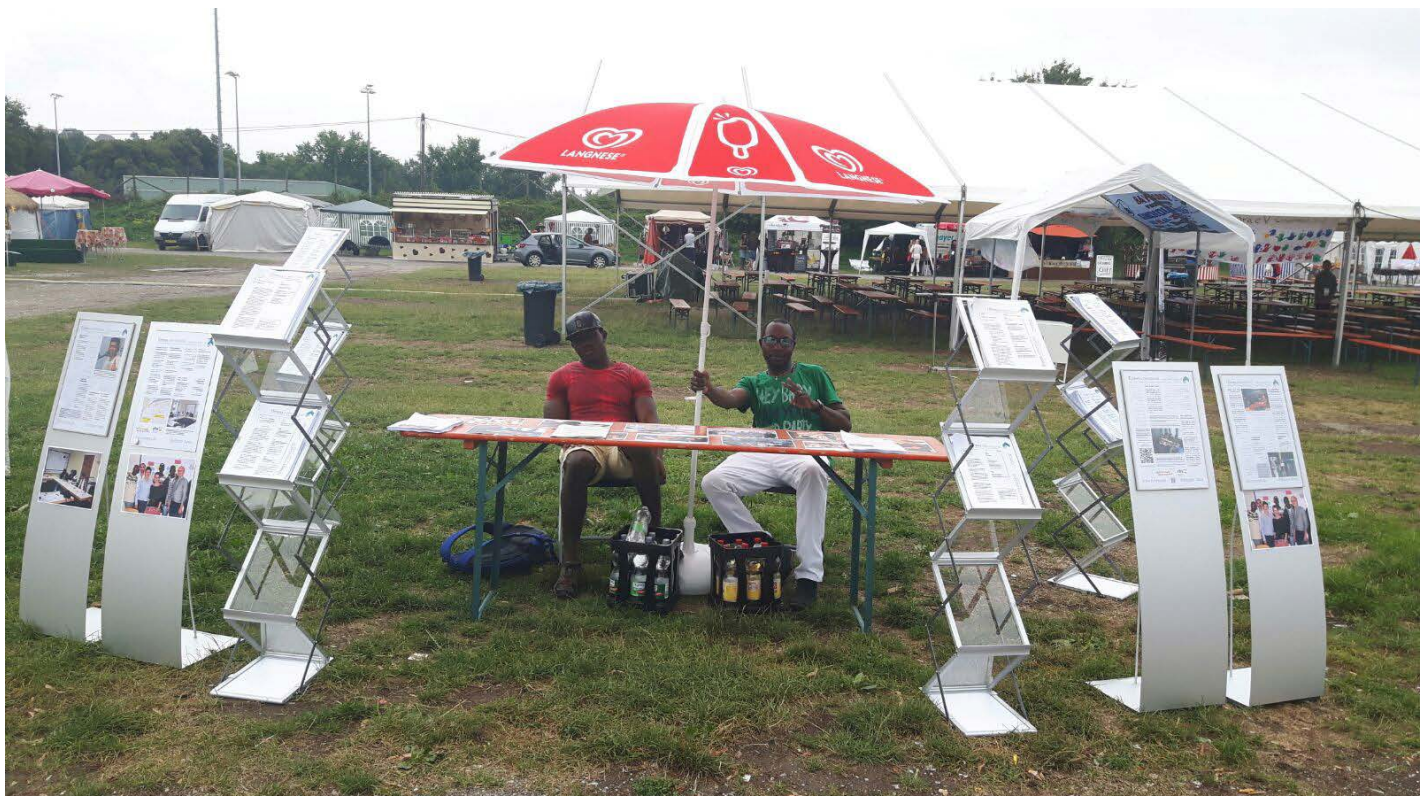
TÜnews International beim Afrika-Festival in Tübingen, 2016.

KulturGUT e.V. Wilhelm-Keil-Straße 50 72072 Tübingen Editor: Wolfgang Sannwald www.tunews.de