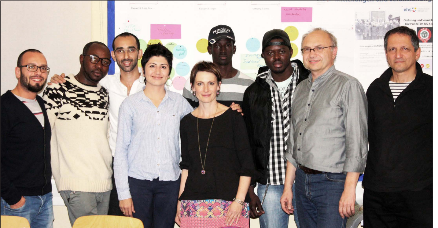
Das erste Treffen von Tünews International im Dezember 2015

شادي بلقيس: اقرا Tünews international في مدرسة infö وفائدتها بالنسبة لي انها تساعدني بمعرفة كل الاخبار الهامة عن توبنغن وتساعدني ايضاً بممارسة اللغة الألمانية.