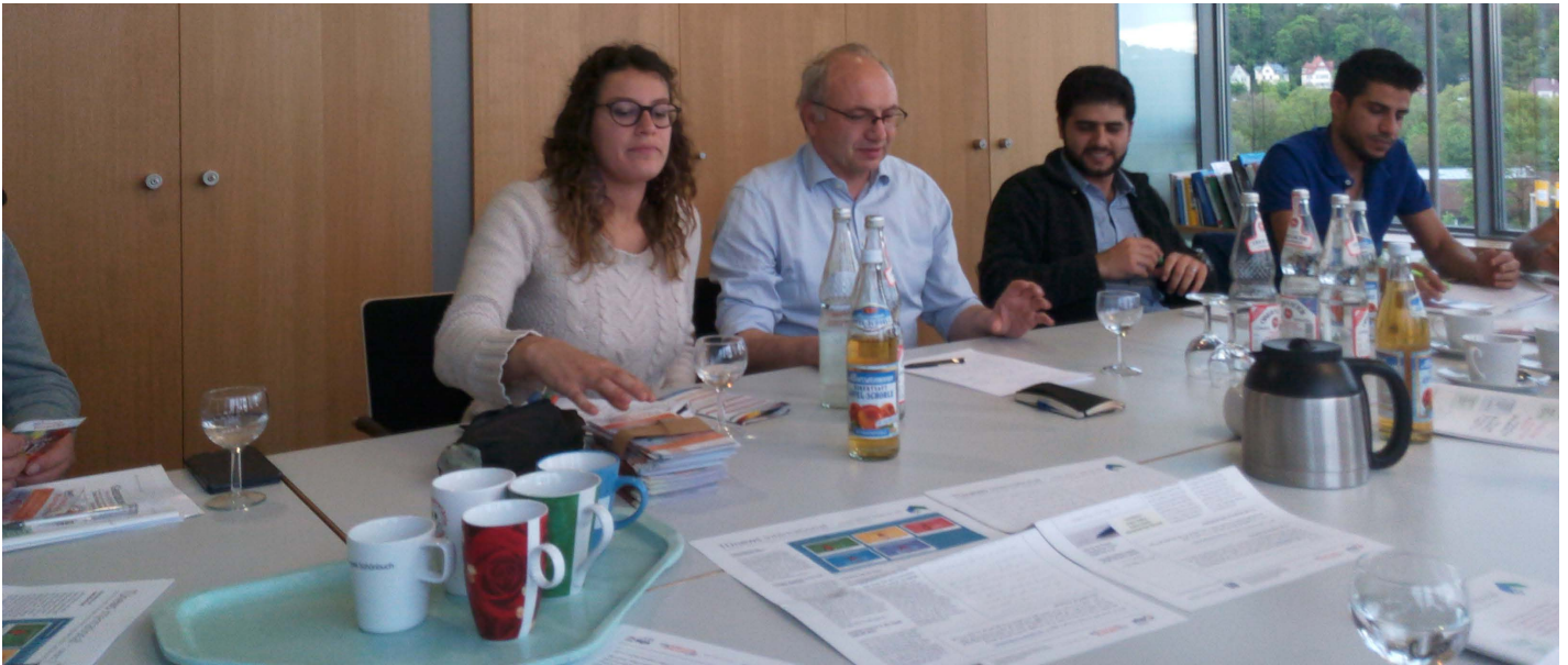
unten: Das Redaktionsteam bespricht ein Thema.